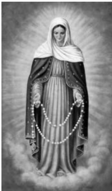
Mayo, un mes entero con María

María lo ha decidido. Ahora nosotros ya no podemos demorarnos, sino que debemos decidimos. No basta agotar la paciencia de los hombres ; especialmente de los que esperan la justicia, el amor y la paz ¿por qué entonces queremos acabar con la paciencia de Dios? (cfr Is 7,13) Pongamos fin a toda altivez, al espíritu de orgullo, de superioridad, de división, a toda soberbia y a todo pecado. Dejemos de contemplarnos a noso-